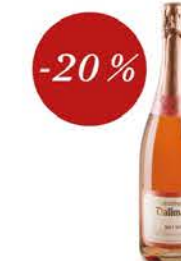
Champagne Dallmayr Brut Rosé