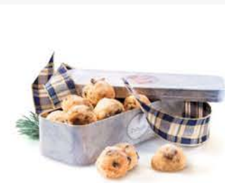
Stollenkonfekt Engeldose Dallmayr