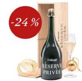
Champagne Dallmayr Réserve Privée Grand Cru 2000