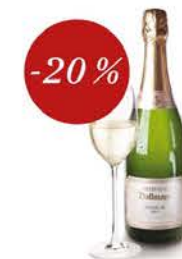
Champagne Dallmayr Premier Cru Brut